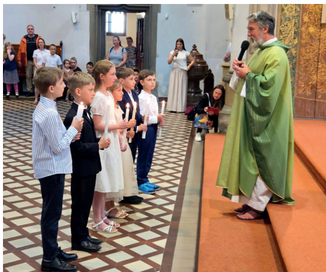
První svaté přijímání