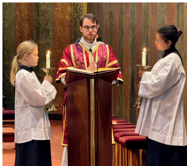
Ondřejova homilie 24. května