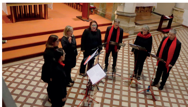
Fotografie z loňské Noci kostelů